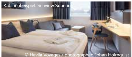
Kabinenbeispiel: Seaview Superior